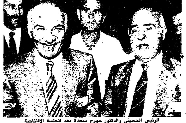
الرئيس الحسيني والدكتور جورج سعاده بعد الجلسة الافتتاحية

احتجاجاً على الانحياز الأميركي اصابة فلسطينيين في الضفة والاضراب ليشل الأراضي المحتلة علم من مصادر فلسطينية ان فلسطينياً ثانياً قتل عصر امس بالرصاص خلال مواجهات عنيفة بين المتظاهرين والجيش الإسرائيلي. وحدثت هذه المواجهة في بلدة نابلس وان سبعة عشر آخرين اصيبوا بالرصاص في الأراضي المحتلة. واوضحت هذه المصادر ان الشاب ساهم مبروكه (٢٠ عاماً) اصيب برصاصة في راسه ونقل الى مستشفى الاتحاد في نابلس حيث تبين لاطباءه انه فارق الحياة. وكانت مصادر فلسطينية واخرى عسكرية متطابقة اعلمت في الصباح وفاة شاب فلسطيني قتل بالرصاص خلال مواجهات في قرية بسلسون الغربية من مدينة غزة بينما جرح اثنان من المعتقلين. وذكرت مصادر فلسطينية ان